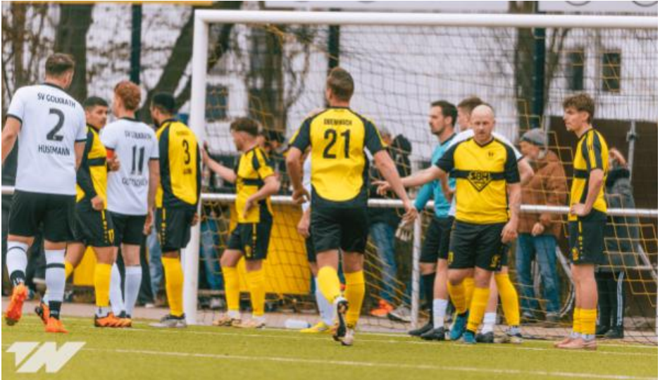
Spielszenen – Oberbruch gegen Golkraht